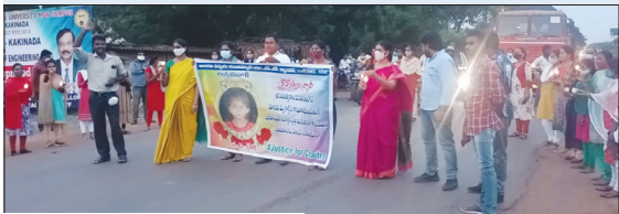
కొవ్వొత్తుల ర్యాలీ నిర్వహిస్తున్న దృశ్యం