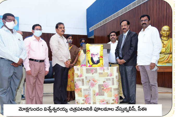
మోక్షగుండం విశ్వేశ్వరయ్య చిత్రపటానికి పూలమాల వేస్తున్న వీసీ, సీఈ