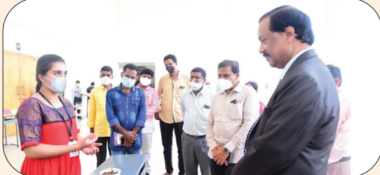
ప్రోజెక్టులను పరిశీలిస్తున్న వీసీ, సీఈ