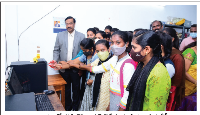
విద్యార్థులతో కలిసి వైఫై ఇంటర్నెట్ సేవలను ప్రారంభిస్తున్న వీసీ